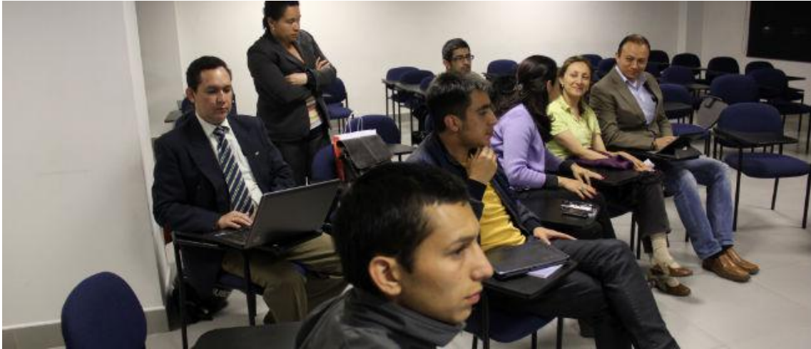
XVII Reunión UxTIC 4 octubre de 2013, Fundación Tecnológica Autónoma de Bogotá- FABA.