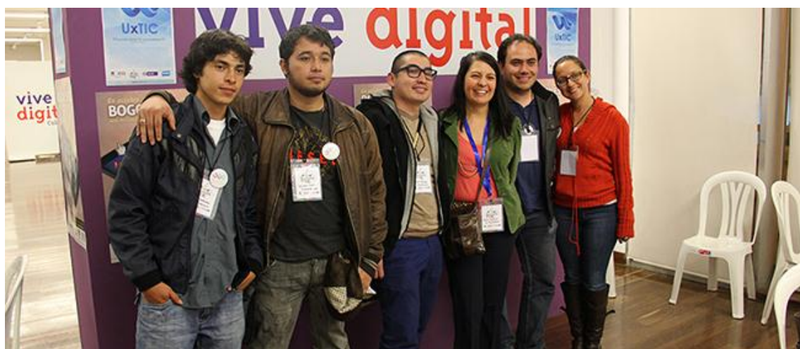
Integrantes del debate: SexualizaTIC y la experiencia de realizar una publicación colaborativa.

Uno de los logros más significativos de la red sin duda alguna ha sido la creación y organización del Foro UXTIC, el cual en sus dos versiones ha reunido a la comunidad académica entre otros profesionales del sector y la ciudadanía en general para intercambiar experiencias alrededor de las Tecnologías de la Información y la Comunicación.