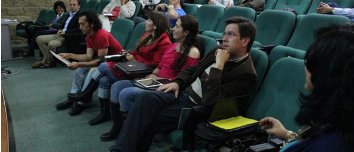
XIV Reunión UxTIC 23 de agosto de 2013, Universidad Distrital Francisco José de Caldas.