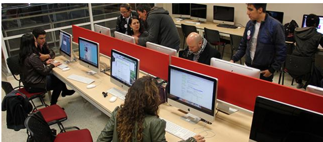
Comité editorial, 3ra Jornada de 48 Horas por la Vida en la Fundación Universitaria Panamericana.

Es una publicación realizada de forma colaborativa en un breve periodo de 48 horas sin interrupción. Durante las tres ediciones de esta publicación colaborativa, la Red Académica de Universidades por las TIC conformó el comité editorial y de selección de esta maratónica jornada.