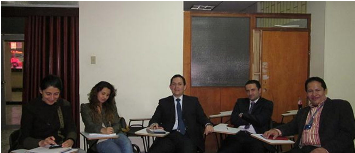
XV Reunión UxTIC 6 de septiembre de 2013, Fundación San Mateo.