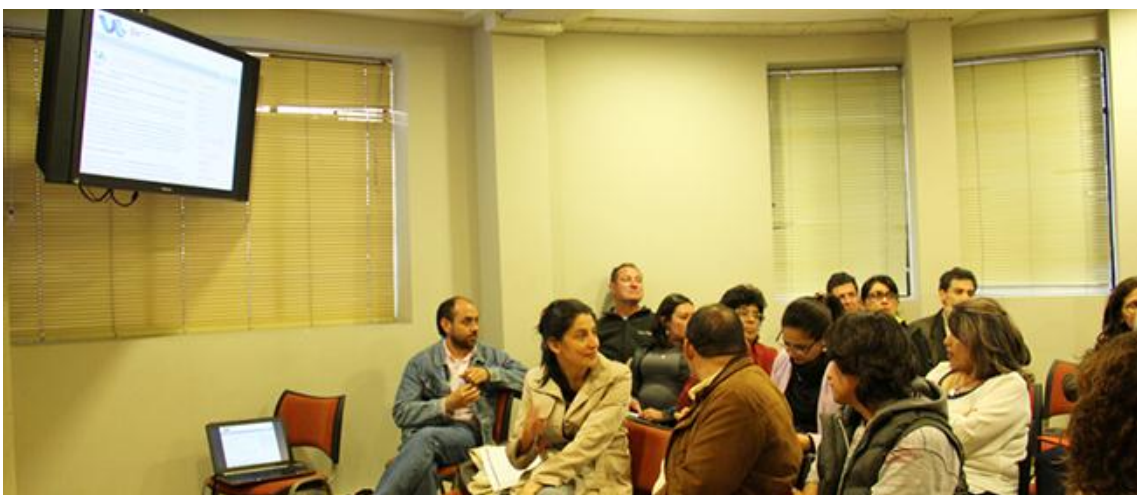
XIII Reunión UxTIC 9 de agosto de 2013, Universidad Jorge Tadeo Lozano.