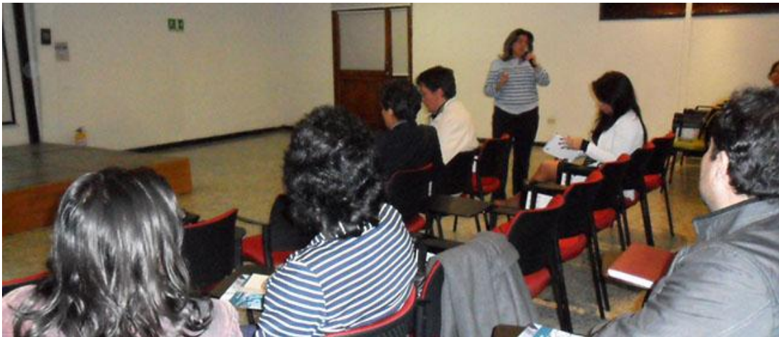
XVIII Reunión UxTIC 18 de octubre de 2013, Universidad Central.