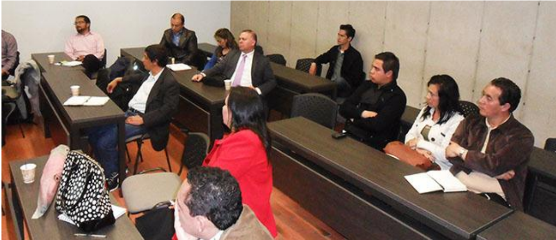
XX Reunión UxTIC 29 de noviembre de 2013, Universidad EAN.