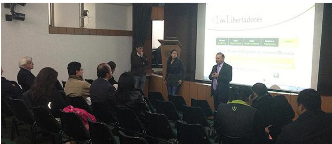
IV Reunión UxTIC 15 de marzo de 2013, Fundación Universitaria Los Libertadores.