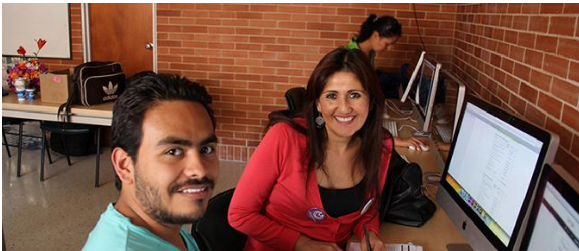
Investigadores del semillero de investigación en de pedagogía y sexualidad de la Fundación Universitaria Los Libertadores.

Agradecemos a la Fundación Universitaria Panamericana por recibir en sus instalaciones a más de 66 personas de diferentes instituciones, universidades, entidades públicas y privadas durante 48 horas sin interrupción.