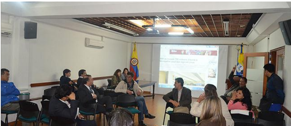
XVI Reunión UxTIC 20 de septiembre de 2013, Corporación Universitaria Unitec.