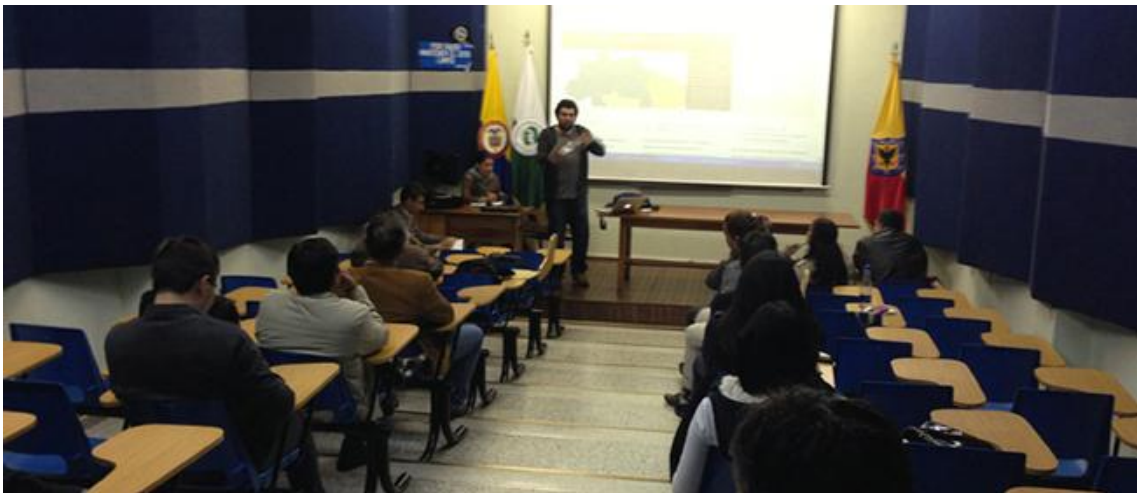
XII Reunión UxTIC 26 de Julio de 2013, Fundación Universidad Autónoma de Colombia- FUAC.