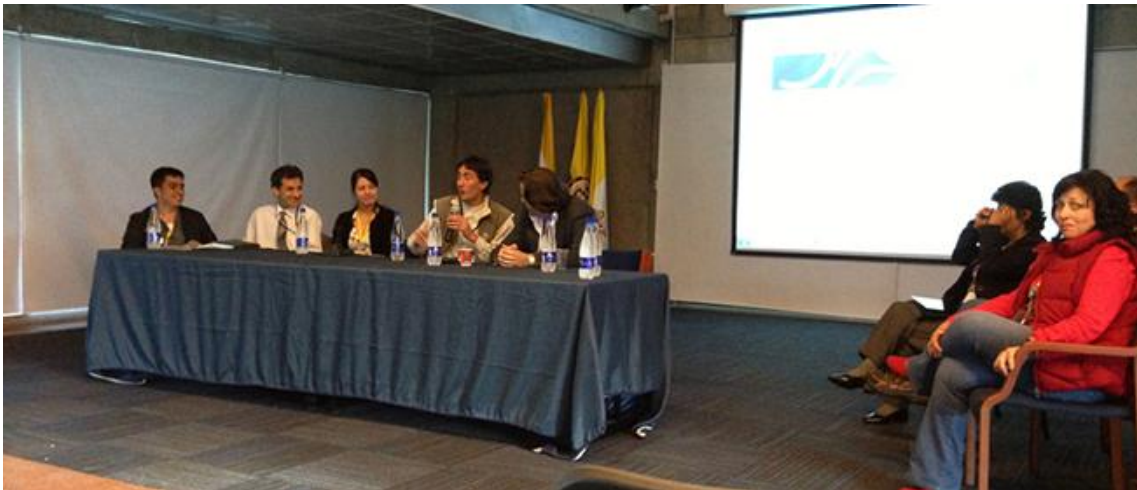
Mesa de trabajo Revista colaborativa ENTRE/N TIC. PYME 360, Universidad Autónoma de Colombia, Fundación Universitaria Panamericana, enREDO, Universidad Jorge Tadeo Lozano y Universidad Distrital Francisco José de Caldas.