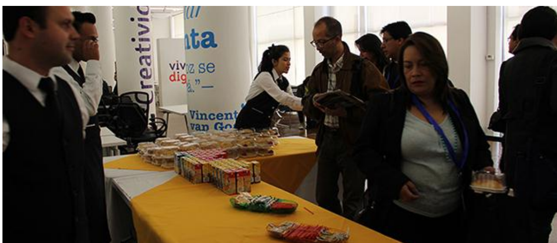
Estudiantes de Gastronomía de la Fundación San Mateo, apoyo logístico.

Resaltamos la labor de la Universidad Distrital Francisco José de Caldas San Mateo, quienes vincularon a sus estudiantes de Ingeniería y Gastronomía respectivamente, en las labores de apoyo logístico del evento.