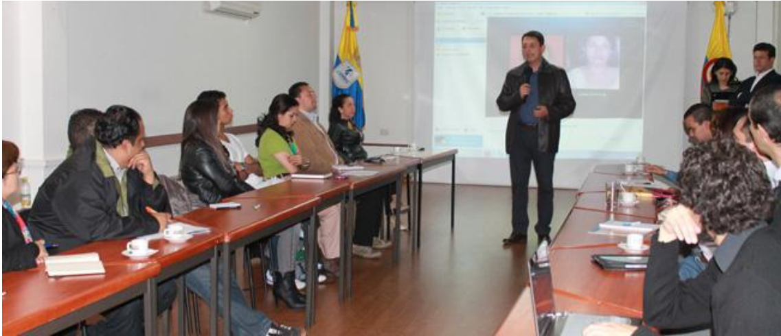
II Reunión UxTIC 22 de febrero de 2013, Corporación Universitaria Unitec.