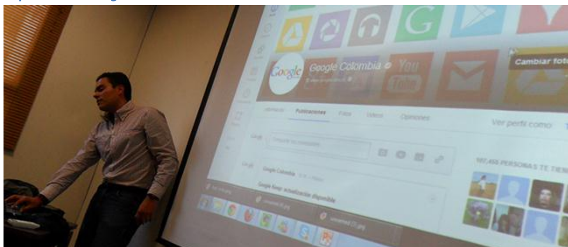
Tallerista Google, capacitación Google en la Universidad EAN

Con el apoyo de UXTIC se ofreció a los delegados, estudiantes, docentes de las universidades que conforman la red y asistentes continuos, la capacitación de Google Plus, el objetivo de la actividad estuvo enfocado a enseñar a los asistentes a utilizar e implementar la herramienta Hangout. Para esta oportunidad Google puso a disposición dos de sus talleristas, quienes estuvieron encargados de dirigir la formación a los 49 asistentes.