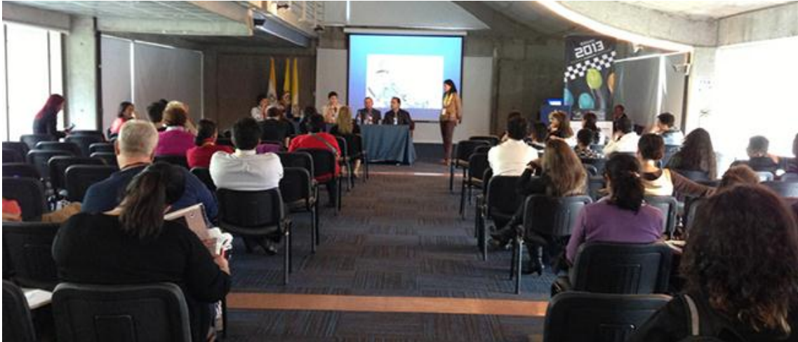
Mesa de trabajo Política de contenidos digitales. Universidad Jorge Tadeo Lozano, La Red de Universidades por las TIC - UxTIC y el Ministerio de Cultura.