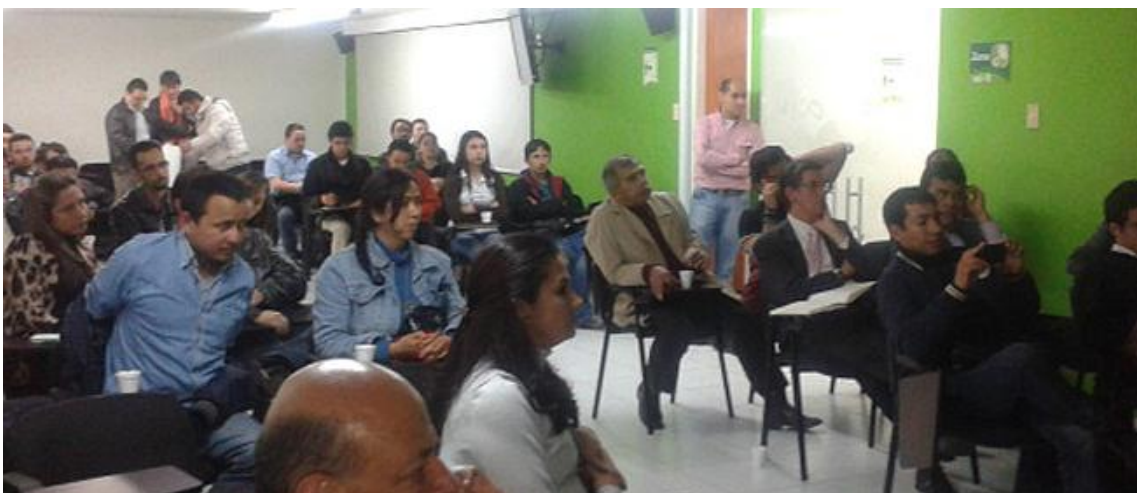
VII Reunión UxTIC 3 de mayo de 2013, Corporación Unificada Nacional de Educación Superior-CUN.