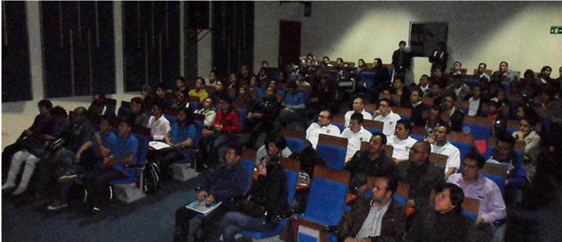
VIII Reunión UxTIC 17 de mayo de 2013, Universitaria Agustiniana- Uniagustiniana.