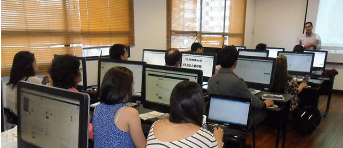
Capacitación herramientas Google Hangout, Universidad EAN.