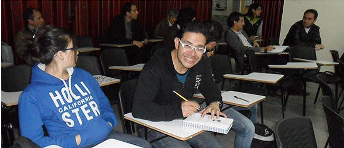
V Reunión UxTIC 5 de abril de 2013, Fundación San Mateo.