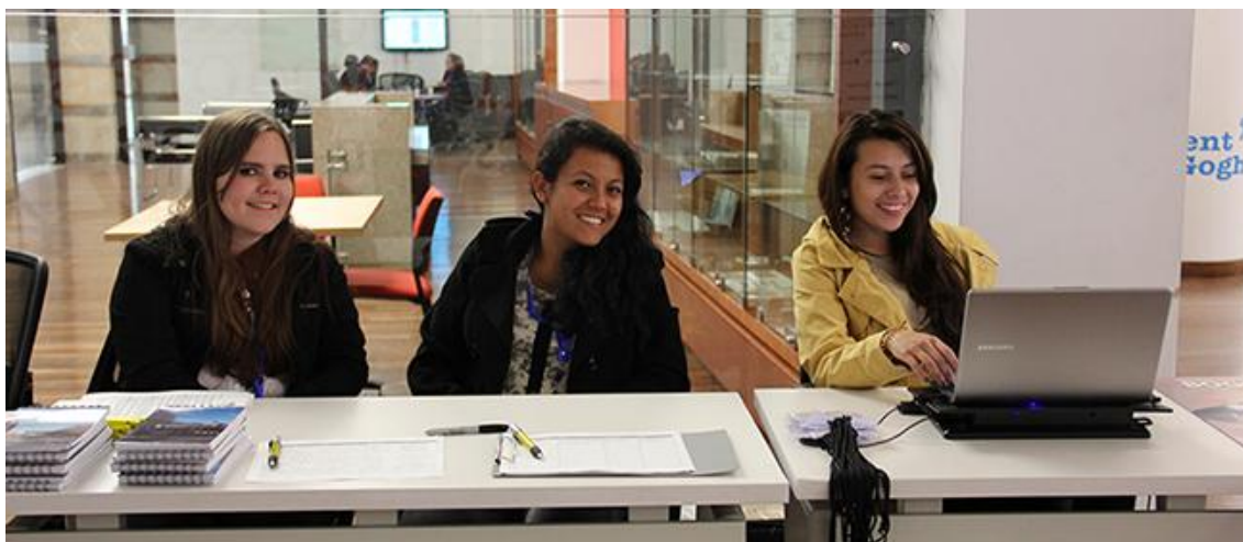
Estudiantes de Ingeniería de la Universidad Distrital Francisco José de Caldas, apoyo logístico.

Agradecemos a todos los aliados que hicieron posible este evento, principalmente Alta Consejería Distrital de TIC de la Alcaldía Mayor de Bogotá Universitario Nacional ZOOM, por difundir, convocar y divulgar en tiempo real el Foro Bogotá UxTIC a través de sus redes sociales, boletines y demás plataformas de comunicación.