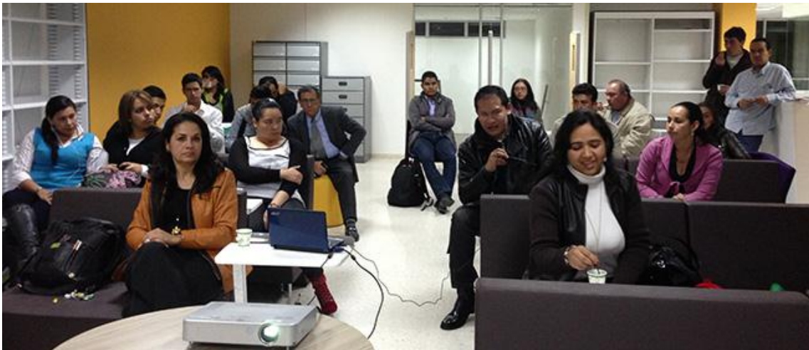
III Reunión UxTIC 1 de marzo de 2013, Fundación Universitaria del Área Andina.