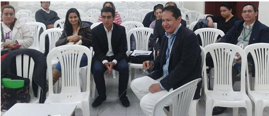
XIX Reunión UxTIC 15 de noviembre de 2013, Fundación San Mateo.