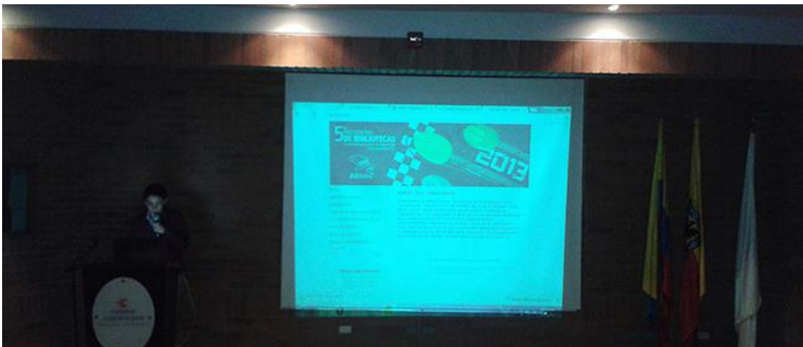
IX Reunión UxTIC 31 de mayo de 2013, Fundación Universitaria Panamericana- Unipanamericana.