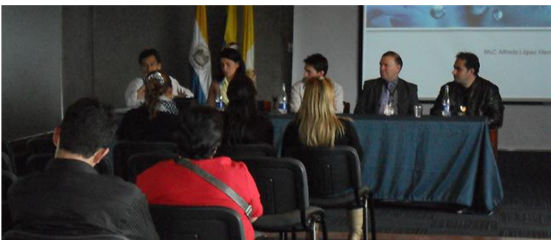
X Reunión UxTIC durante BiblioTIC 14 de Junio de 2013, Pontificia Universidad Javeriana.