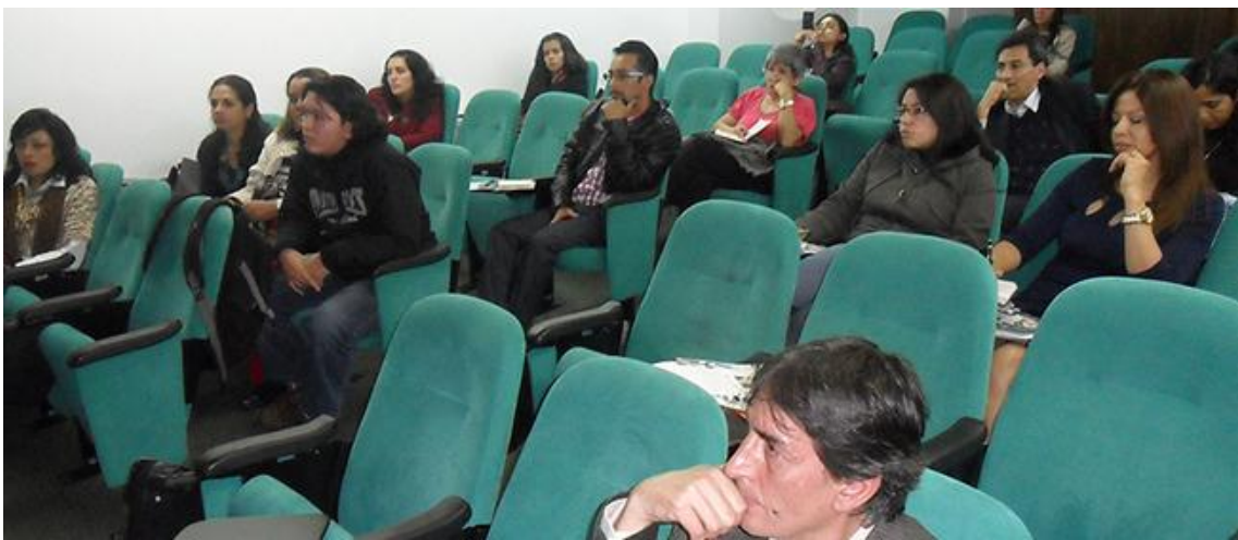
VI Reunión UxTIC 19 de abril de 2013, Universidad Santo Tomás.