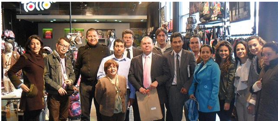
1 reunión UxTIC febrero 6 de 2013, Nalsani S.A. - Tutto Flagship store Zona T.

Desde la creación de la red, los delegados de las instituciones que la conforman, se han reunido de manera dinámica y continua con el fin de gestionar proyectos y trabajar en conjunto con otras universidades en torno a la implementación, aprovechamiento y apropiación de las TIC.