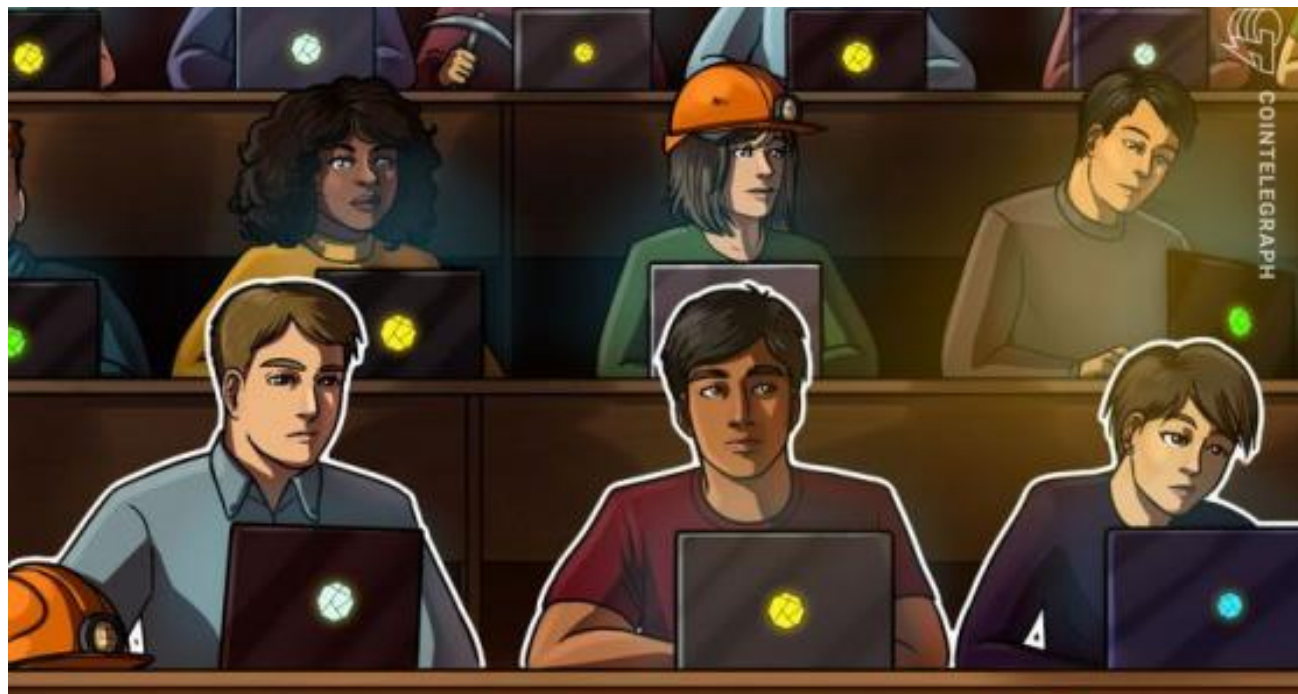
Lanzan curso académico sobre blockchain y criptomonedas para universitarios en Colombia

La red de Universidades UxTIC, enfocada en el fomento de la investigación en tecnologías de la información; Fundación Binance y Univida (Unidad Académica Virtual y a distancia), lanzaron un SPOC (pequeño curso privado en línea, por sus siglas en inglés) con enfoque académico, que integra conocimientos de blockchain y criptomonedas en Colombia y cuya finalidad es formar a futuros investigadores y docentes y propiciar una mayor investigación en el país para el uso de monedas digitales y tecnología de cadena de bloques. Así lo informaron a Cointelegraph en Español, a través de un comunicado.